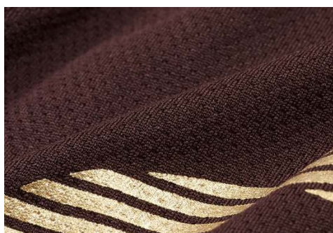
通気性のいいメッシュ素材

秋冬シーズンらしいシックな新色ダークブラウンを採用しました。通気性のいいメッシュ素材で、スポーツシーンにも対応し、ムレにくく、快適な履き心地を持続できます。 渋めのダークブラウンにゴールドカラーの「C」ロゴの存在感がスタイリッシュで、スポーティーな雰囲気演出しています。