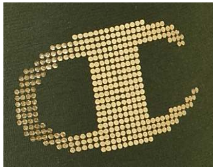
ドットで構成された「C」ロゴ