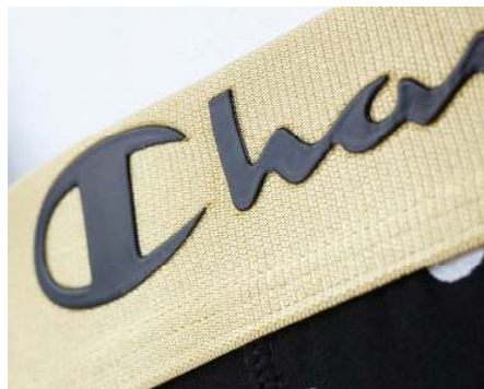
シリコンタイプの「Champion」ロゴ

品番: C26-028 価格: ¥1,500(本体価格) 素材: 吸汗速乾ペア天竺 (コットン 60%、ポリエステル 35%、ポリウレタン 5%) サイズ: M-LL カラー: ブラック、ブラック×ゴールド