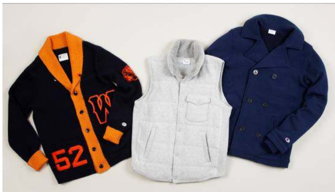
(左から)ウールカーディガン(C3-YA02)、REVERSE WEAVE ベスト(C3-Y601)、REVERSE WEAVE ピーコート(C3-Y603) ※画像データをご希望の際は㈱ジャパン・カウンセラーズ(TEL:03-3523-8210)までお問い合わせください。

スウェットの風合いを活かした新アイテムからヴィンテージの雰囲気満載のアイテムまで チャンピオンの伝統と最新トレンドを同時に体感できるアイテムバリエーションです！