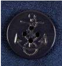
マリントイストな ボタン

リバースウィーブ初のピーコート。身生地には発売以降、その独特の風合いからファンの間でも好評を得ているリバースウィーブ11.5ozを使用しました。ディテールにこだわるチャンピオンらしく、ボタンには錨マークがデザインされたボタンを採用することで、ピーコートらしいマリントイストを表現。また、袖の内側にリブを施すことで「スウェット」アイテムとしての雰囲気を残しました。肉厚なボディの裏地はポアフリース仕様で、寒い冬にはピッタリのアウターです。左身頃の内側には内ポケットを付けました。