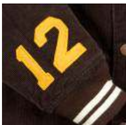
右袖口のフェルトアップリケ