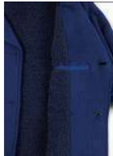
ポアフリースの裏地と 内ポケット