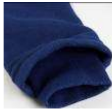
スウェットシャツを思わせる袖内側のリブ