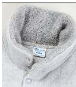
襟周りのポアフリース

肉厚だけでなく、襟周りのポアフリース、中綿キルト仕様のボディで暖かさ抜群のリバースウィーブ ベスト。「アウターを着るにはまだ少し早い、でもトップス1枚では寒い」という端境期に大活躍。コーディネートアクセントにもなり、リバースウィーブのスタイルをもっと楽しみたいという方にピッタリのアイテムです。